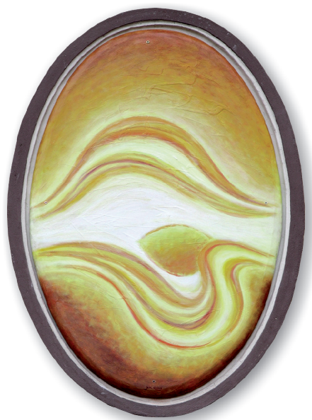
Jiří Černý *1959

Hlavními náměty jeho tvorby jsou krajina a žena. Pravidelně se zúčastňuje workshopů pořádaných Galerií4, ale i jiných symposií u nás i v zahraničí.