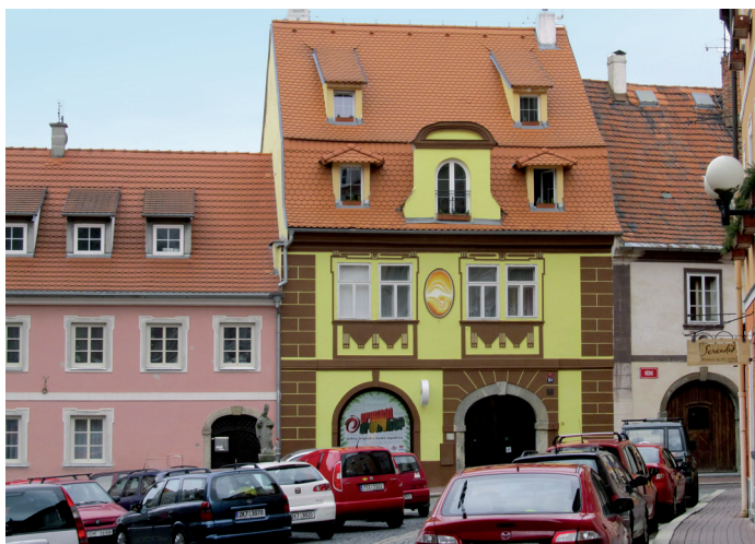
Umístění: Růžový kopeček č. 7

„V této kartuši je naznačeno, že něco vzniklo, vyvíjí se, roste, ale co z toho bude, je tajemství.“